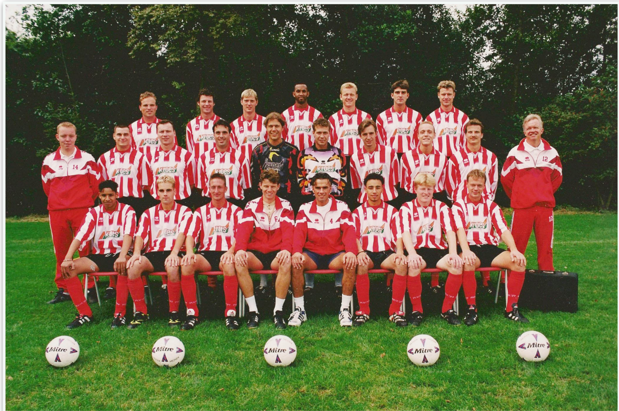
De MVV '27-selectie in het seizoen 1998-1999.

Nu moet ik eerst maar eens goed herstellen en dat dan ook blijven. Wij kijken hier thuis alleen maar naar morgen, dus even geen vervolgtraject in het voetbal.