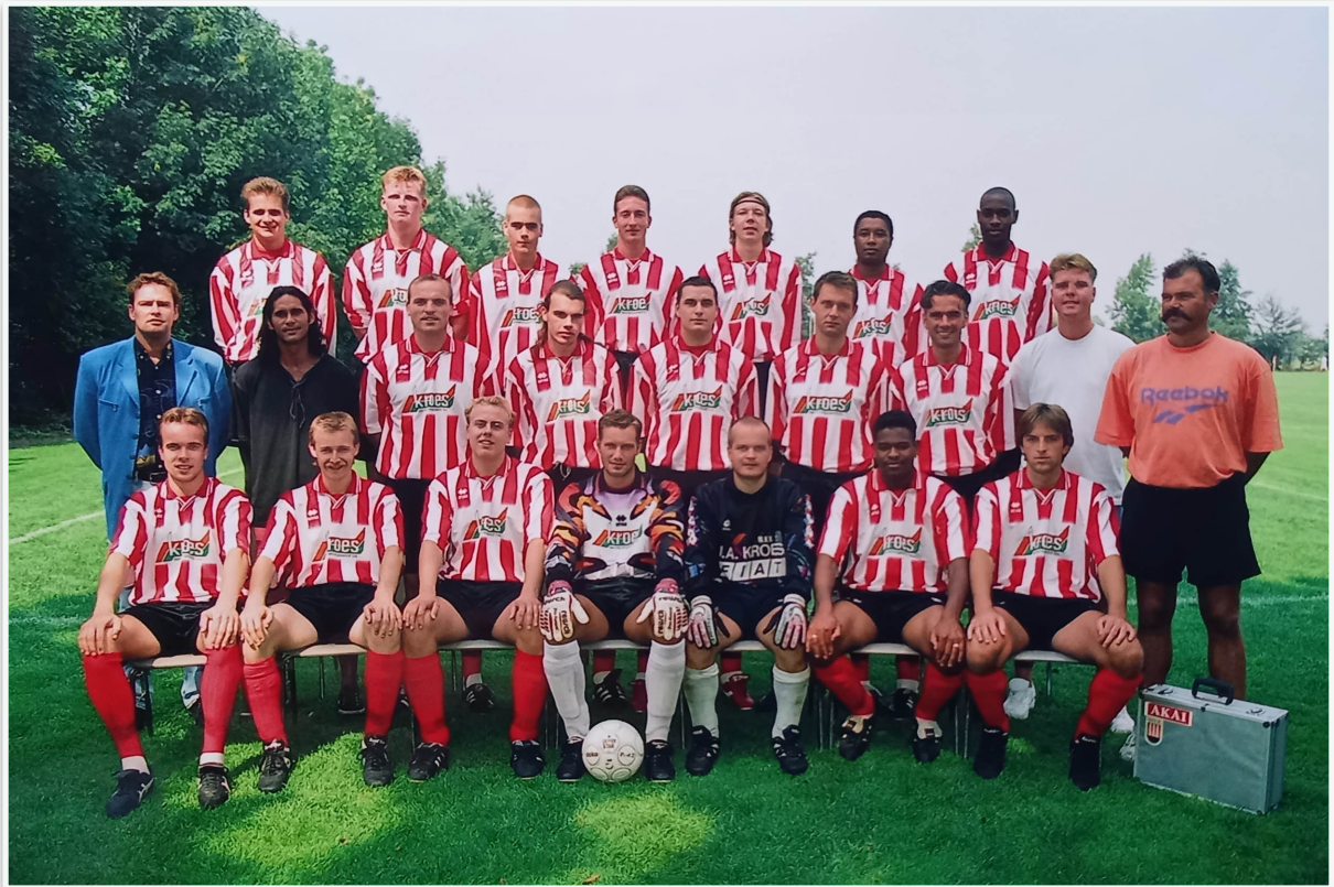
MVV '27-selectie in het seizoen 1996-1997.