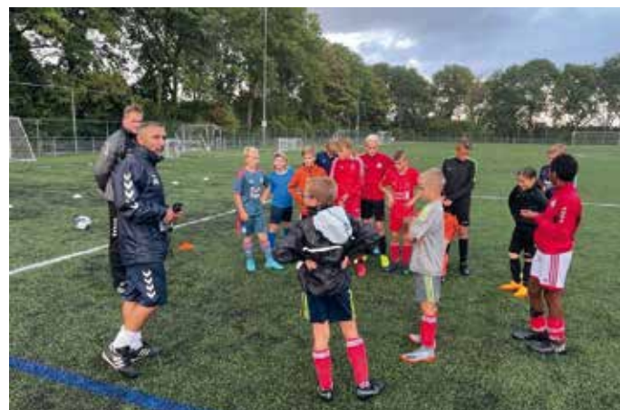
Extra training voor de jeugd op vrijdagmiddag door trainers en spelers van de selectie.